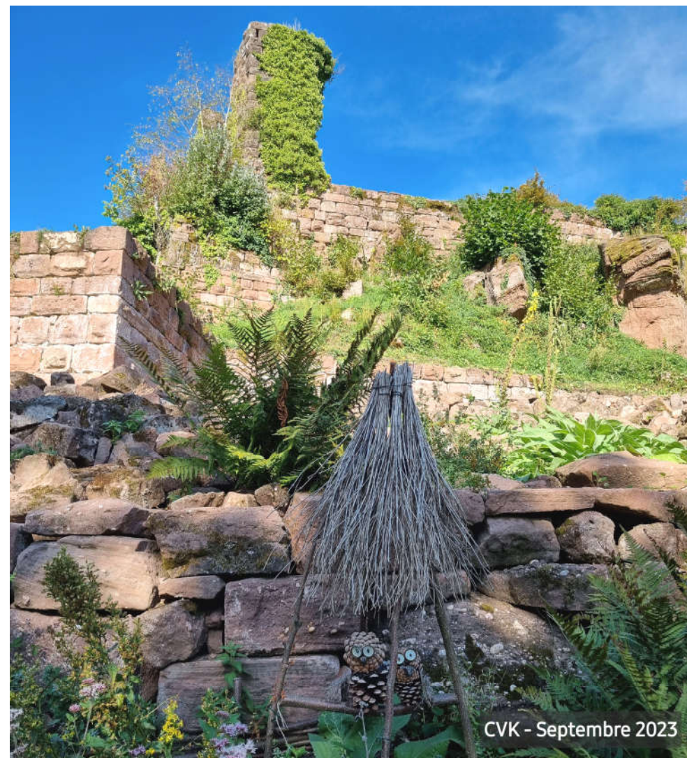
CVK - Septembre 2023